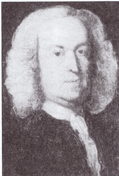
Distributor kolků v osadě Massachusetts Andrew Oliver.

Událost zachytil emotivně a se soucitem k osobě zástupce guvernéra ve svém deníku Josiah Quincy ml., který o několik let později označil téhož muže za „ největšího a nejzlomyslnějšího nepřítele mé země... jenž napáchal tolik