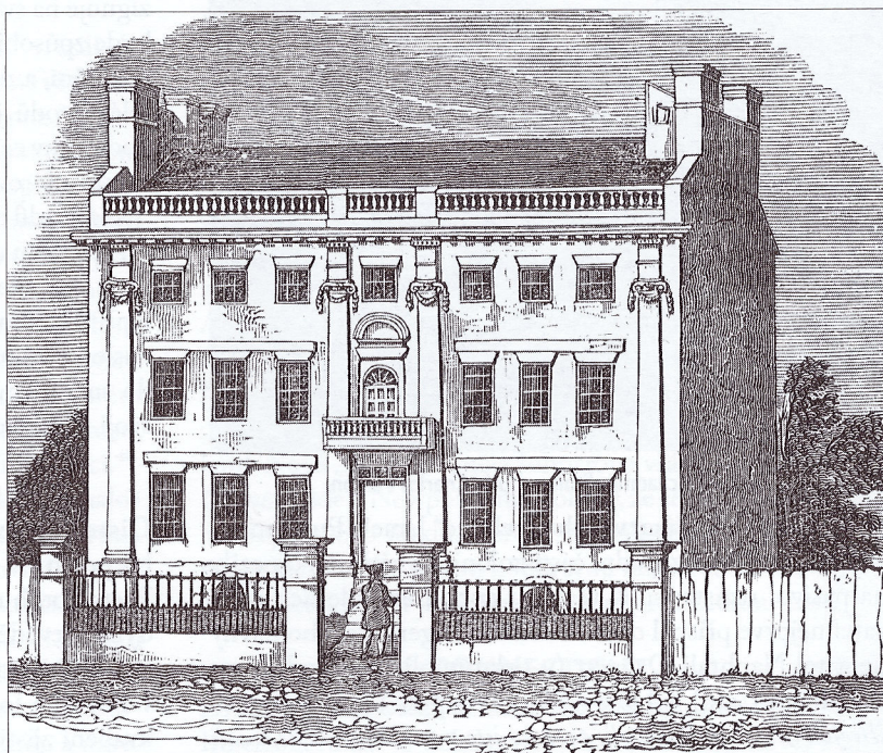
Dům zástupce guvernéra Thomase Hutchinsona v Bostonu. Během nepokojů v srpnu 1765 byl téměř úplně zničen.

Největší demonstrace síly byla na programu následujícího dne, 1. listopadu 1765, kdy vstoupil Zákon o kolkovém v platnost. Již ráno visely na každém rohu plakáty hrozící všem, kdo by se byl jen „dotkl“ kolkovaných dokumentů. V průběhu odpoledne se ulice zaplňovaly rozčilenými obyvateli města. Kolem sedmé hodiny večer se průvod přibližně dvou tisíc lidí se svíčkami a pochodnými vydal na pochod k pevnosti Fort George. Dav s sebou nesl šibenici, na níž byla pověšena figurína zástupce guvernéra. Přibližně ve stejné době se shromáždila druhá, menší